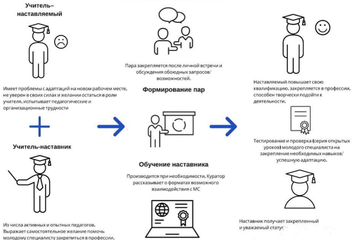
Рисунок 2. Графическое представление взаимодействия по форме «учитель – учитель»