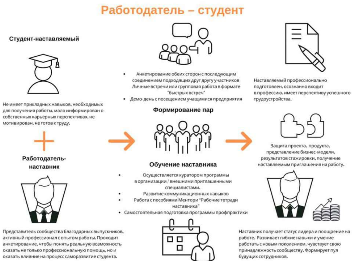
Рисунок 5. Графическое представление наставнического взаимодействия по форме «работодатель – студент»