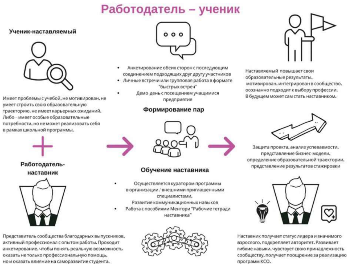
Рисунок 4. Графическое представление наставнического взаимодействия по форме «работодатель – ученик»