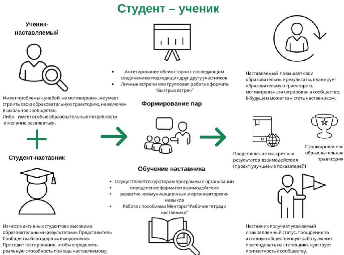
Рисунок 3. Графическое представление наставнического взаимодействия по форме «студент – ученик»