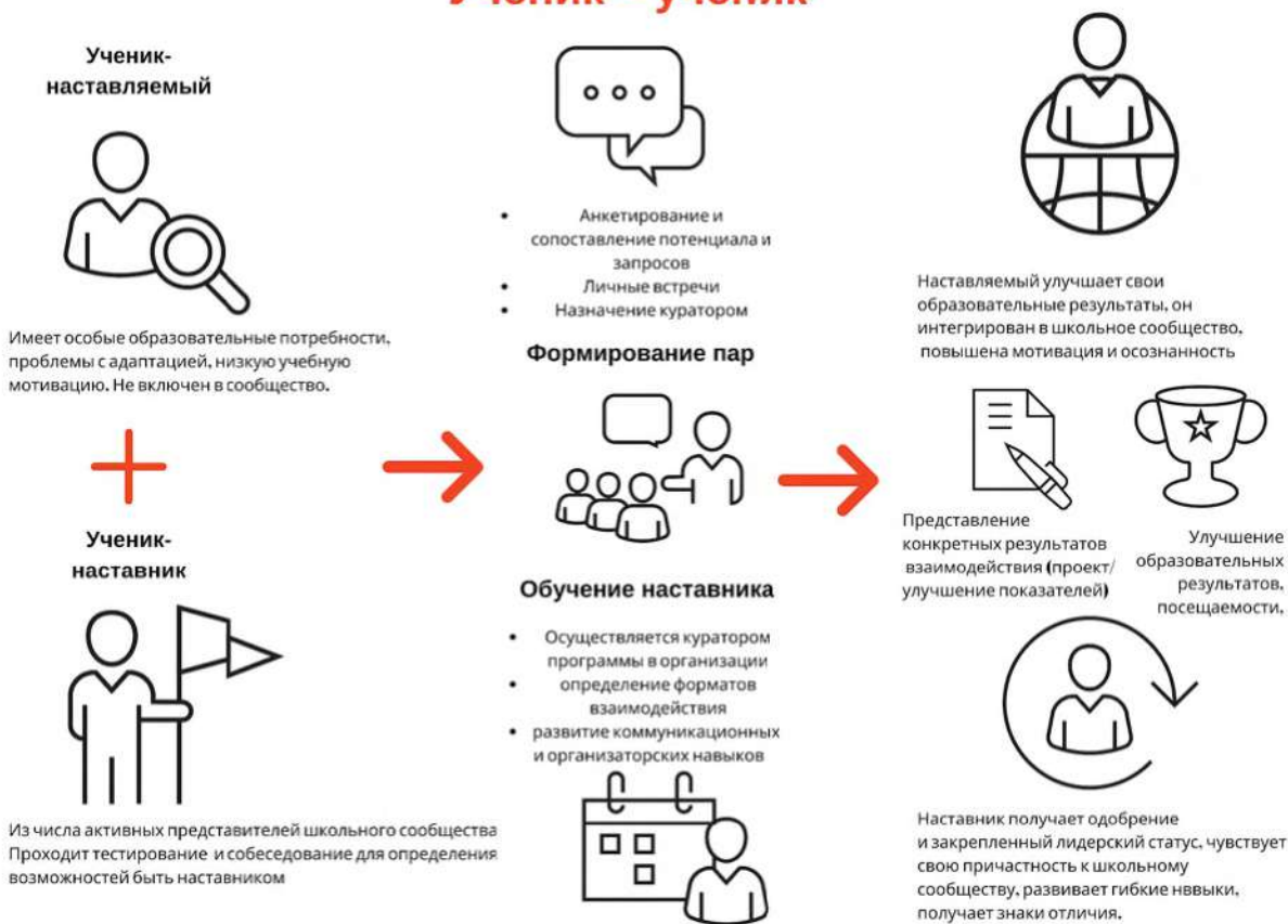
Рисунок 1. Графическое представление взаимодействия по форме «ученик – ученик»